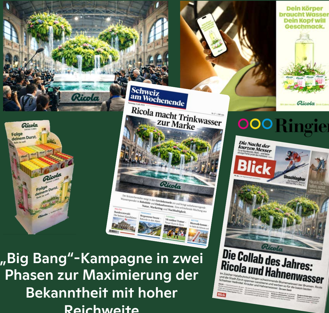
„Big Bang“-Kampagne in zwei Phasen zur Maximierung der Bekanntheit mit hoher Reichweite