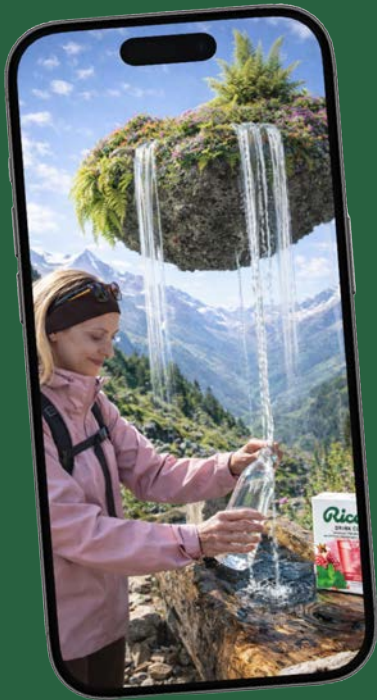
Influencer-Kampagne für Early Interest